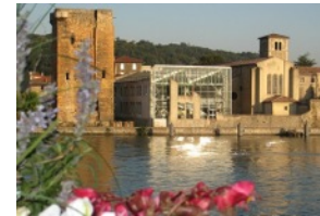
Vienne et Pays viennois, au fil du Rhône